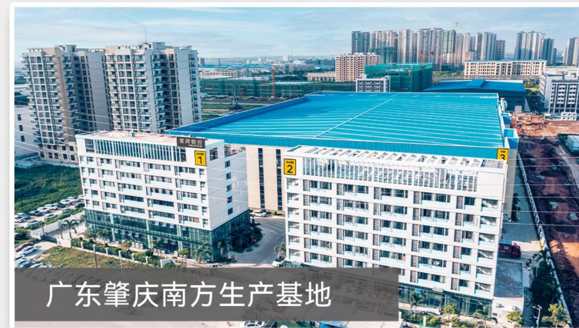
广东肇庆南方生产基地