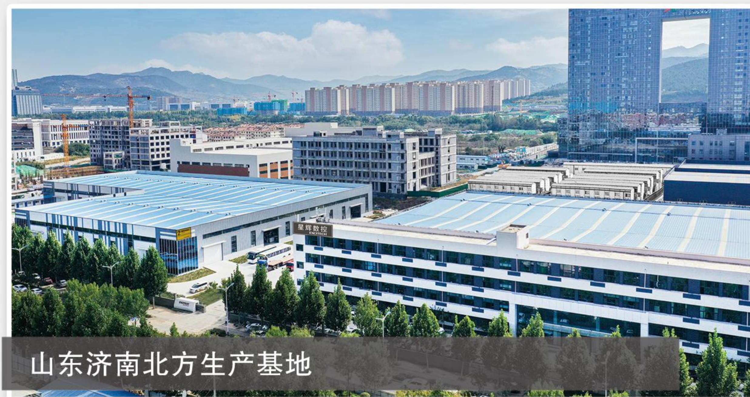
山东济南北方生产基地