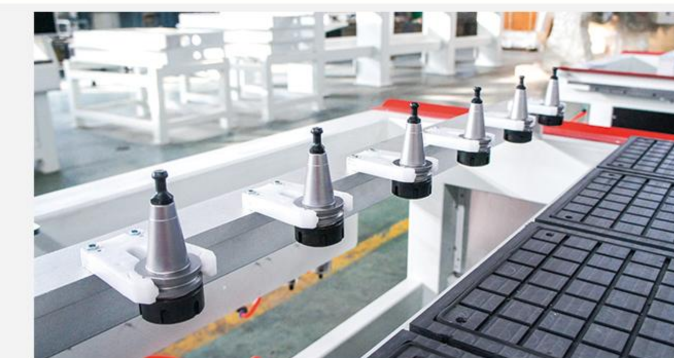
后置排式刀库，换刀简洁快速 Linear tool Changer

一款加强型排式换刀的加工中,机身结构强化处理,工作效能高 High-performance machine with extraordinary value, but at a very economical price